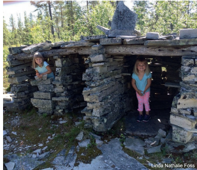
Steinlekehusene ved Skjæråsen.

Det er et overordnet mål at verdiskaping relatert til natur- og kulturarv skal være bærekraftig og ta hensyn til kulturarven som ivaretas som nasjonalparker og verdensarvområder.