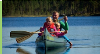
Jan Nordvålen/ Destinasjon Femund Engerdal