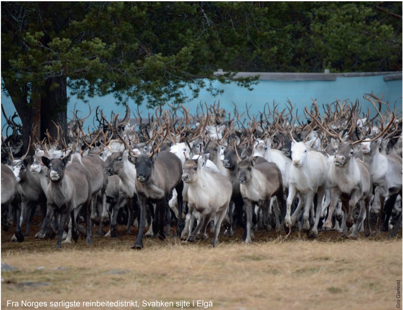
Fra Norges sørligste reinbeitedistrikt, Svahken sijte i Elgå